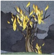
maîtrise du feu