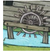
force de l'eau