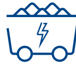
utilisation du charbon