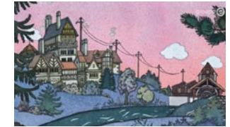
invention de l'électricité