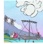
force du vent